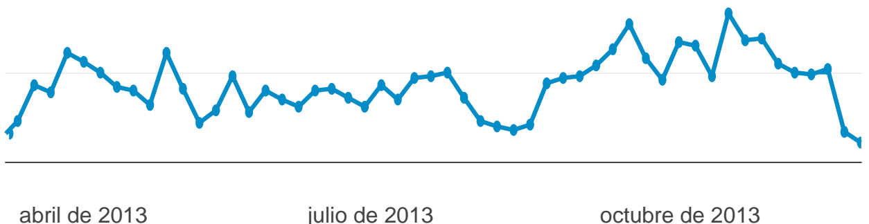
Gráfico 3: Visitas en el ciclo 2013 (enero-diciembre)