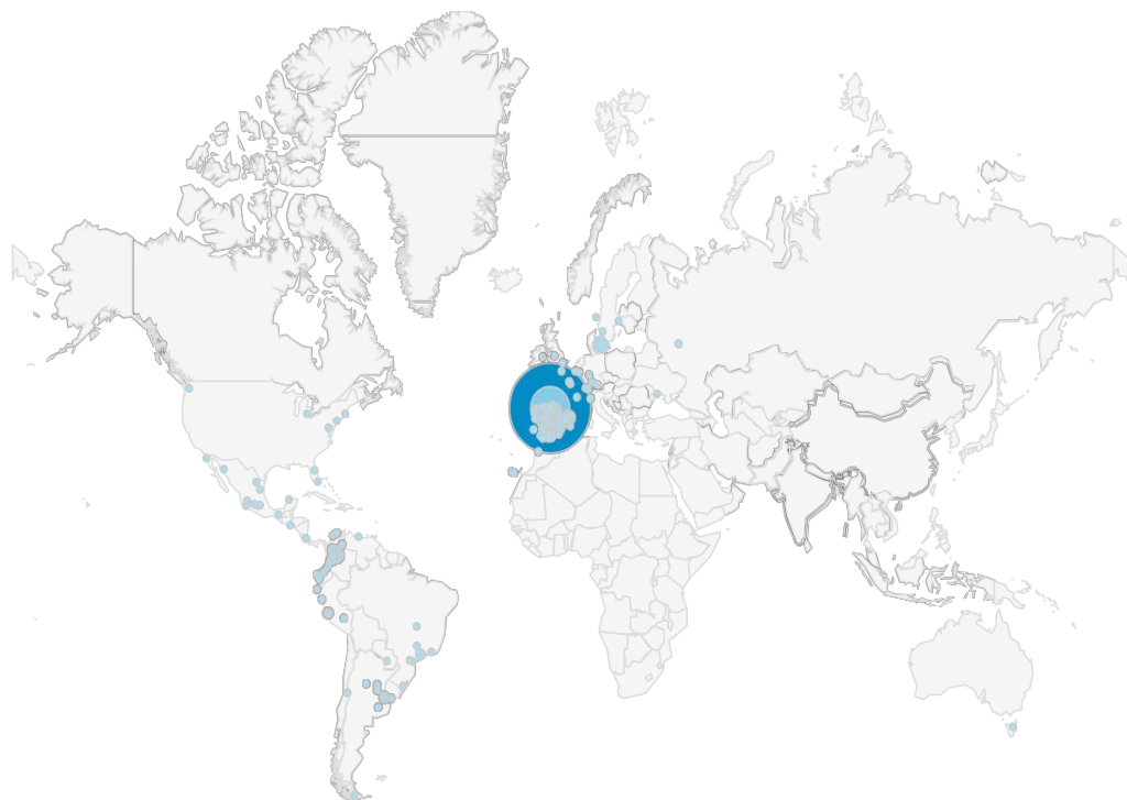
Tabla 2: Distribución de las Visitas