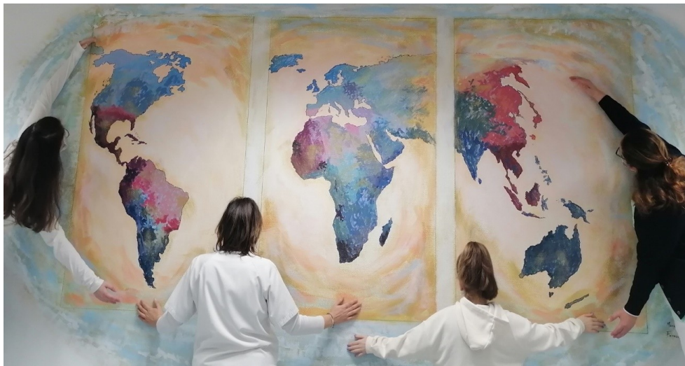
Fotografías ganadoras de la I edición del concurso de Fotografía SaludArte

Código seguro de Verificación : GEN-f1ea-8cbf-99d5-657d-8b9f-b922-2e73-3b4d | Puede verificar la integridad de este documento en la siguiente dirección : https://portafirmas.redsara.es/pf/valida